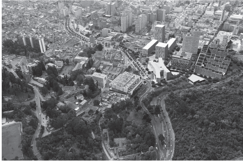
Arriba. Plan Parcial Fenicia.